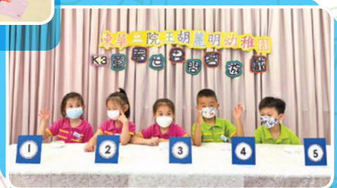
童看世界 - 問答比賽