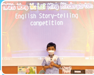
English Story-telling competition