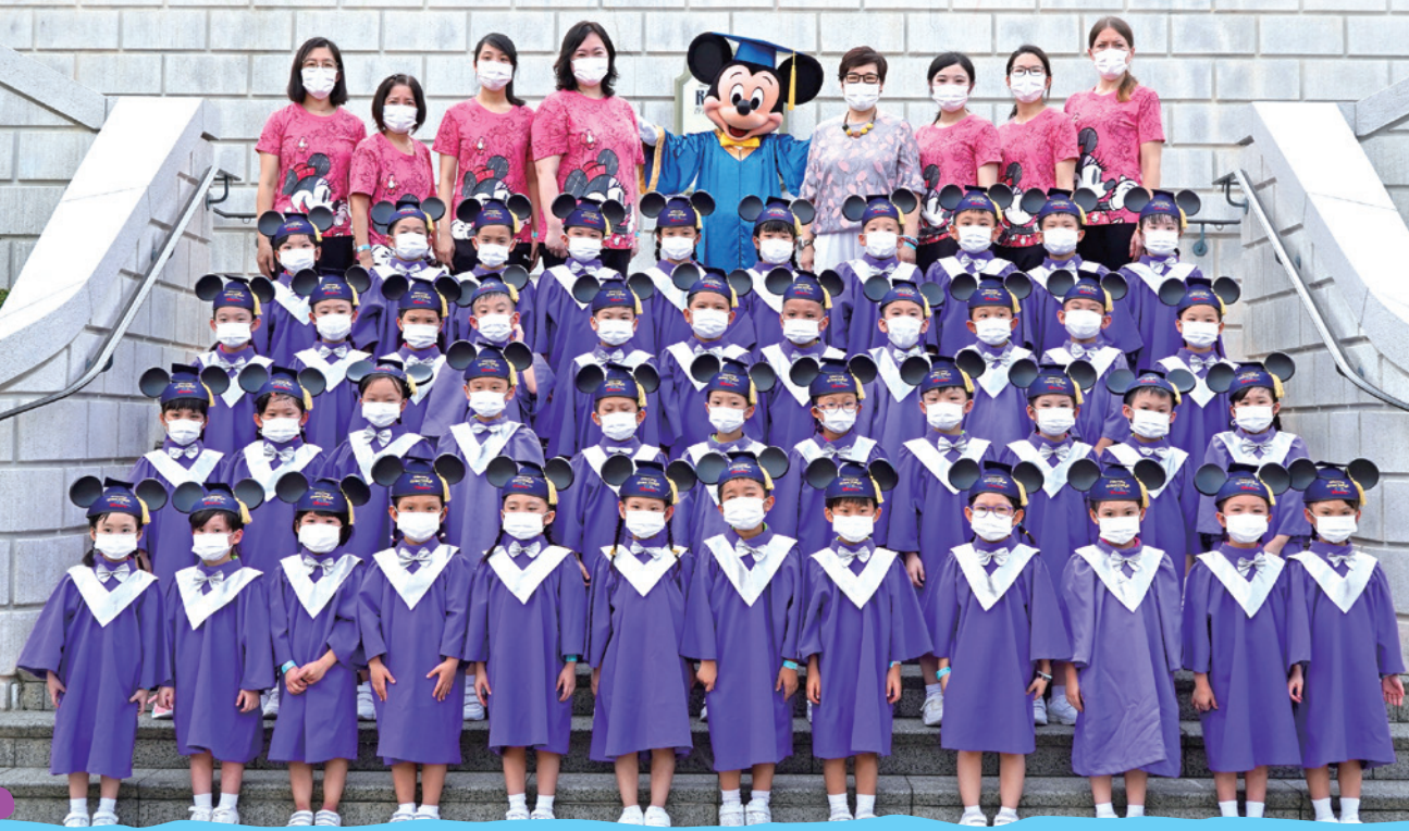
K3高班畢業旅行-上午班