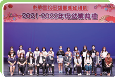
結業禮頒發家長義工委任狀