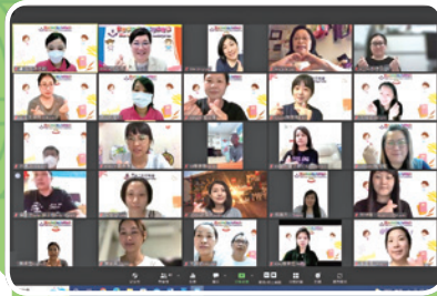
下學期家長交流會 (視像形式)