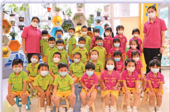
K1Ba.m. / K1Bw.d