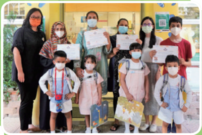
「非華語家長學堂」畢業