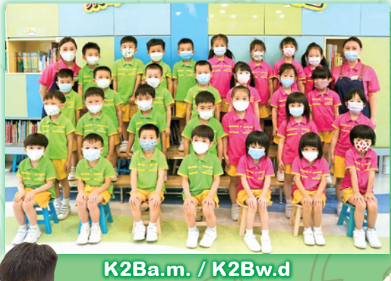
K2Ba.m. / K2Bw.d