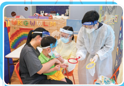
2019 冠狀病毒疫苗接種