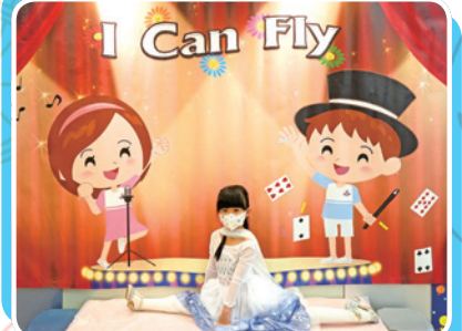
I Can Fly