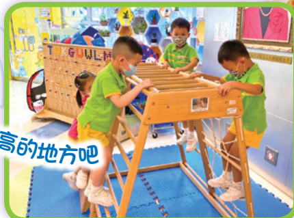
爬上去高高的地方吧