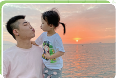
父親節慶祝活動 (短片製作)