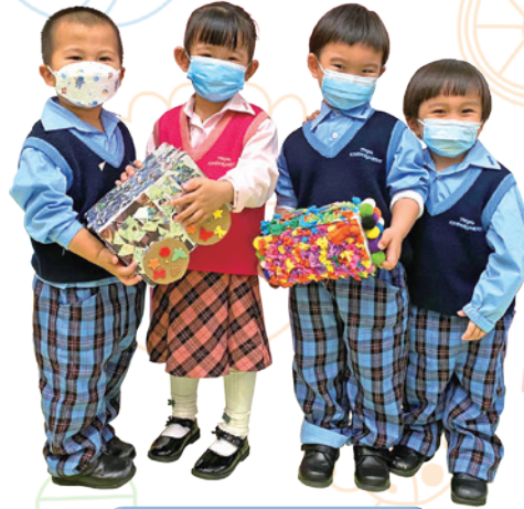
K1 我送玩具車給小刺蝟