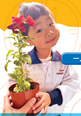
一人一花種植活動