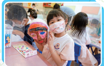
K3 關超然太平坤士兒童藝術獎