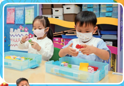
奇趣日本積木課程