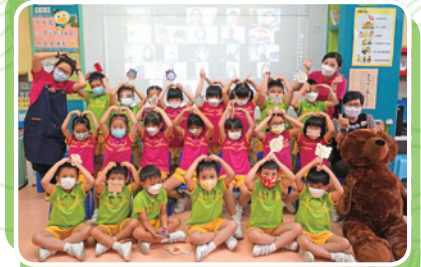
母親節慶祝活動 (視像形式)