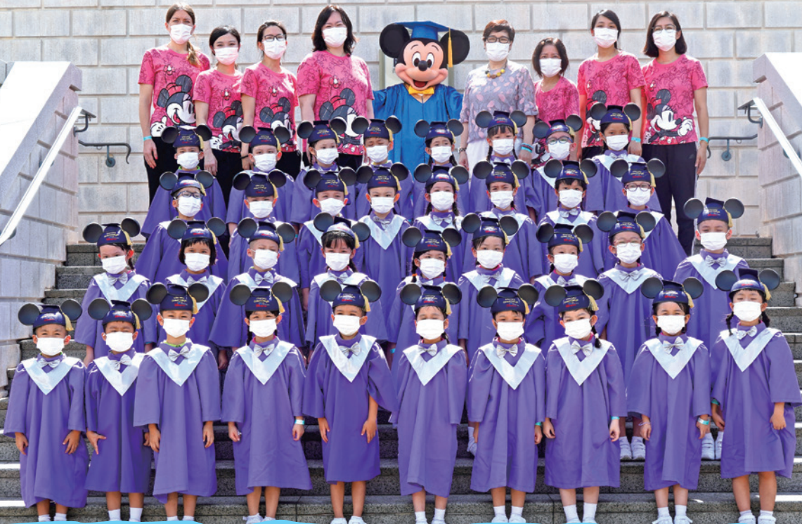
K3 高班畢業旅行-下午茶